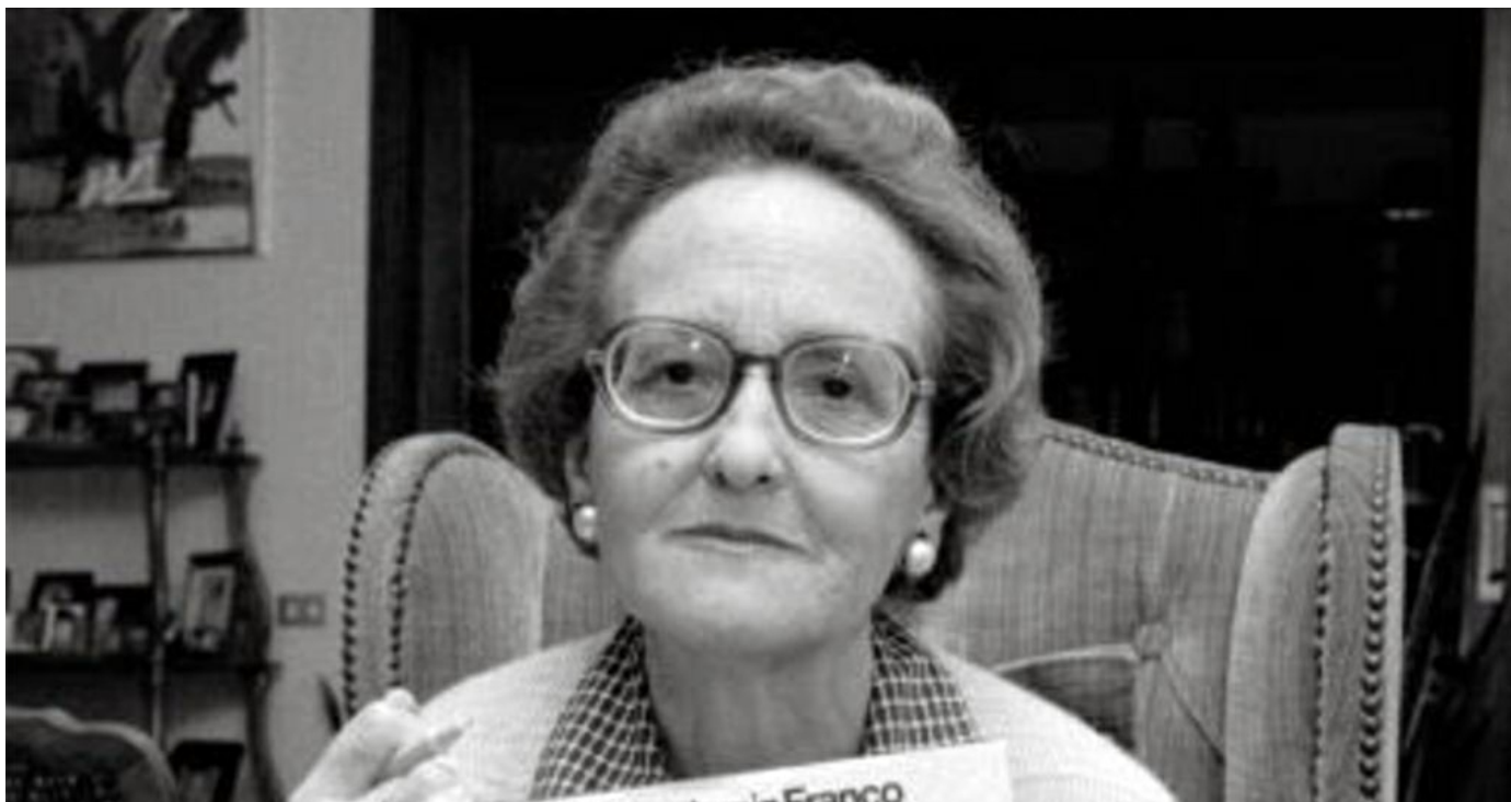
Pilar Jaraíz Franco / ARCHIVO