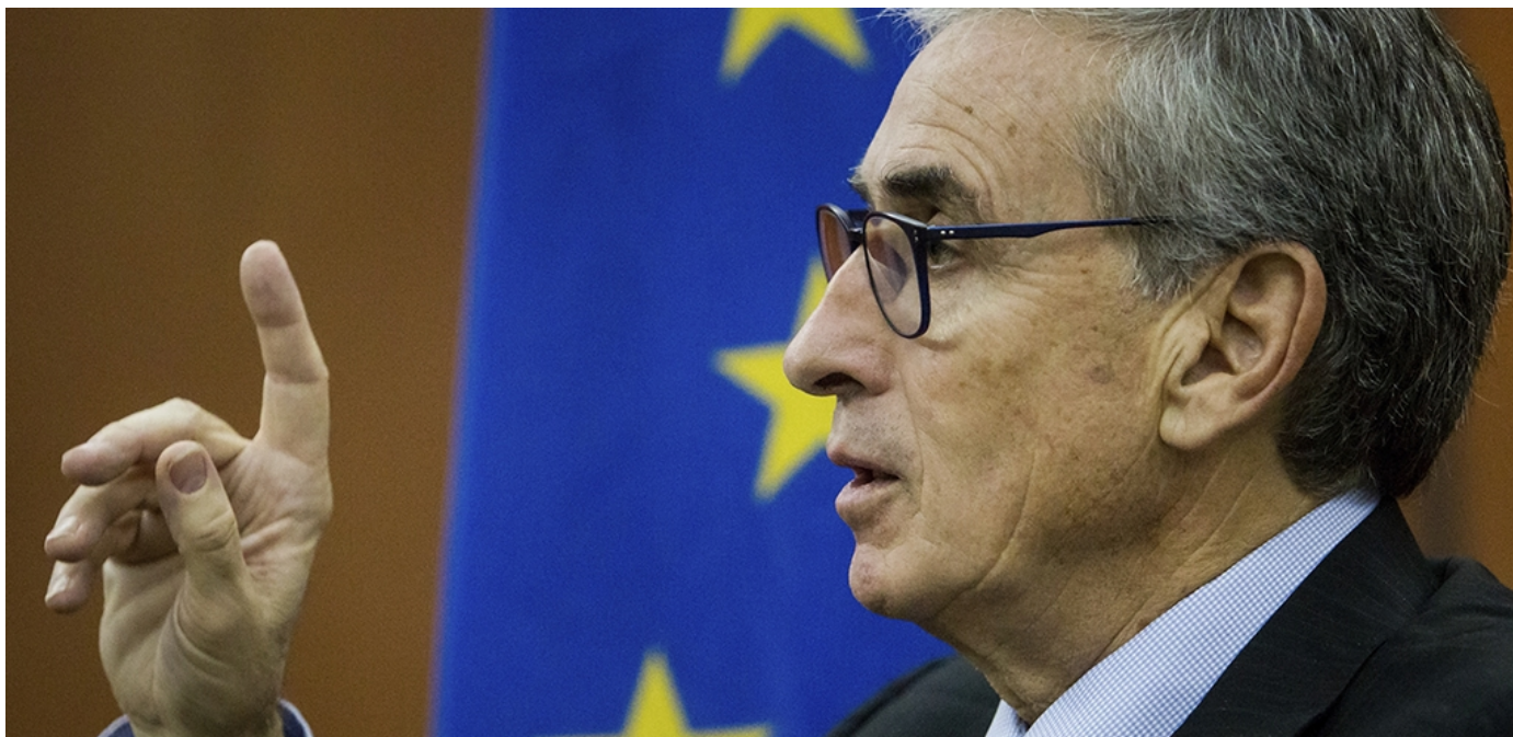
El presidente de la delegación socialista española, Ramón Jáuregui