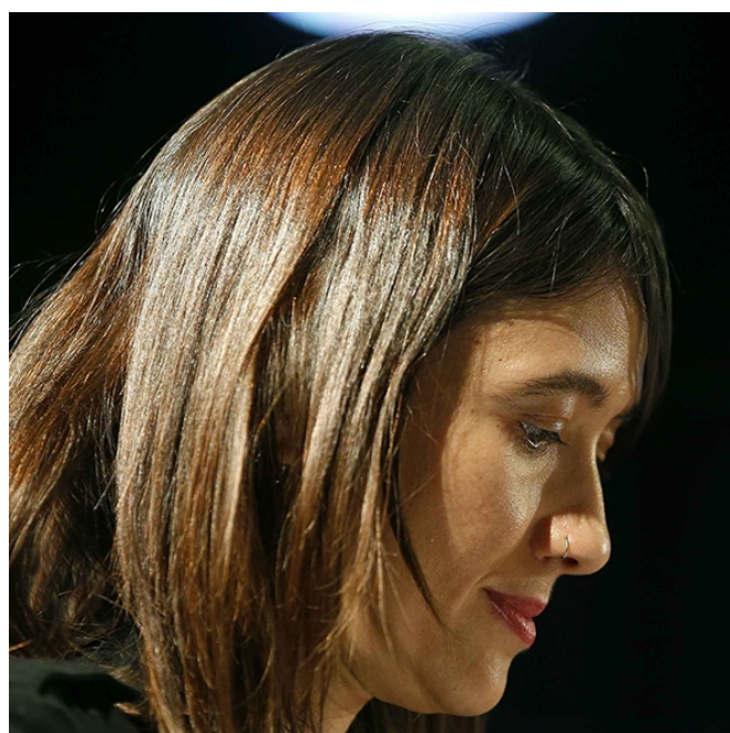
Nuria Parlon