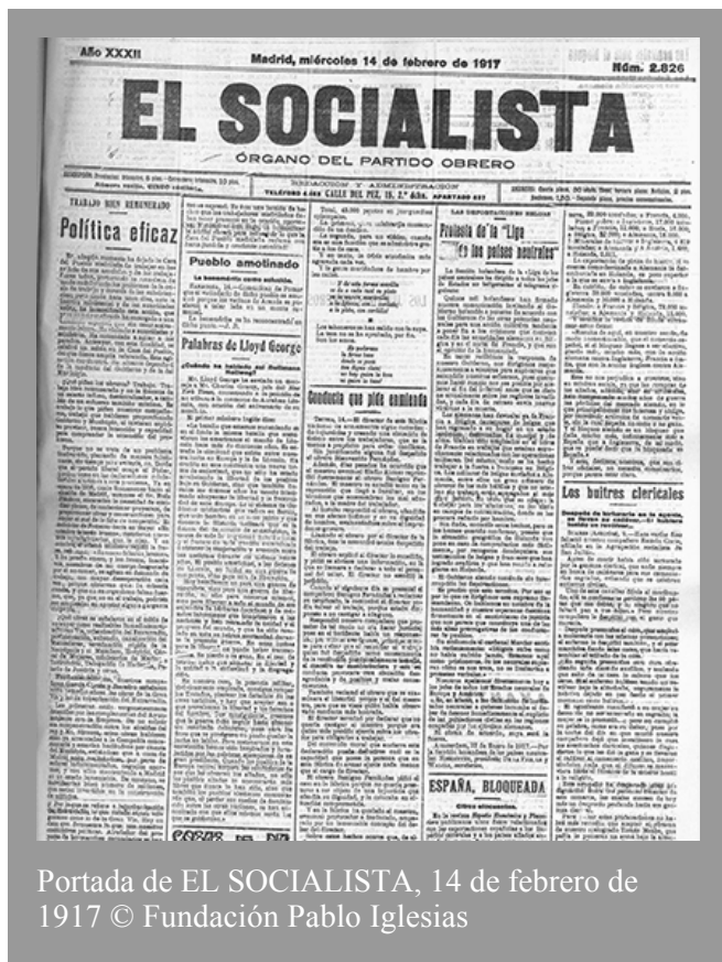
Portada de EL SOCIALISTA, 14 de febrero de 1917 © Fundación Pablo Iglesias

En ningún momento ha dejado la Casa del Pueblo madrileña de trabajar en beneficio de sus asociados y de los trabajadores todos, procurando se resuelvan de modo satisfactorio los problemas de la crisis de trabajo y carestía de las subsistencias; pero desde hace unos días, ante la inercia ministerial y de las autoridades todas, ha intensificado esta acción, que para su mayor eficacia ha encargado a una Comisión especial, que sin cesar activamente labora. Ha visitado a autoridades y ministros. Ha comenzado a agitar a los parados. Anteayer, con esta finalidad, se celebró un mitin en... © Fundación Pablo Iglesias